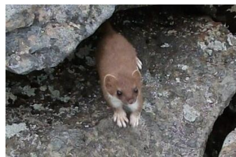
紅葉が素晴らしく雷鳥やオコジョに出会えて展望も最高の御嶽山