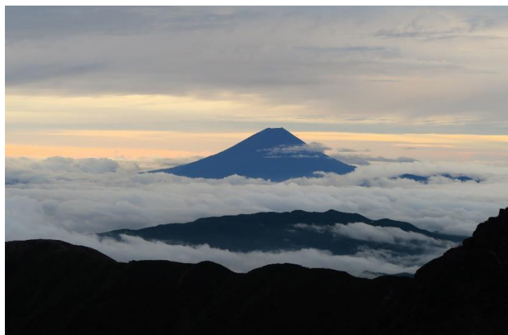
標高第2位北岳からの富士山

自分のペースで自由に設定できる登山は、筋肉の強化、心肺機能の向上や森林浴によるリラックスなどすばらしい効果が期待できます。また四季折々の花や紅葉と自然にふれ合い楽しめます。登山に興味ある方は声をかけてください。