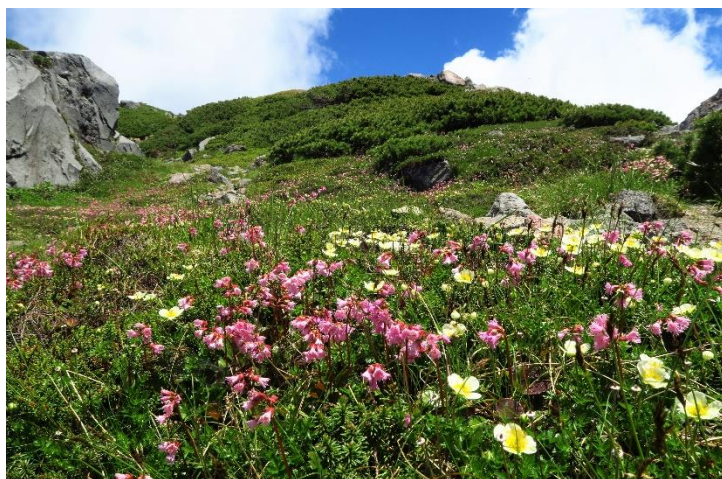
高山植物の宝庫で花の百名山になっている白山